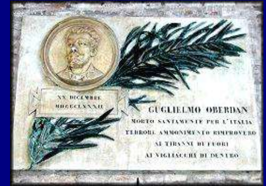
G. Oberdan 1858–1882