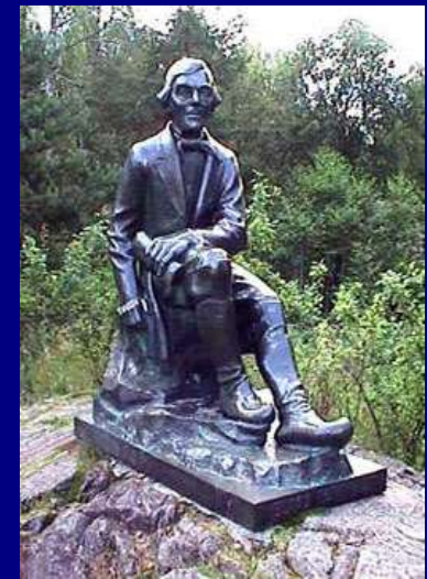
E. Lonrot 1802–1884