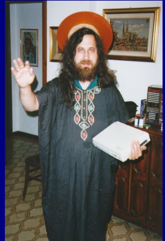
Mr Richard Stallman